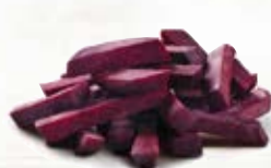
Rödbeta stavar 18853, 10 mm, 3 kg 1853, 15 mm, 3 kg