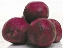
Rödbeta hel skalad 1780, 5 kg 1738, bin, 300 kg

Blanda i färsrätter och minska på köttet. Mättande, hälsosamt och klimatsmart.