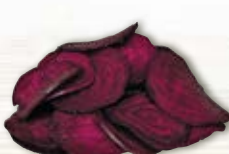
Rödbeta hyvlad 18883, 2 mm, 3 kg