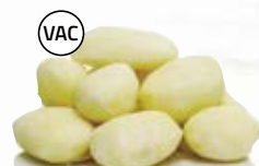
Mospotatis 21017, vac, 39-43 / 43-55 mm, 7 kg