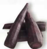
Lila morot 1797, 5 kg