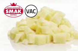
Potatis tärnad 21076, vac, 10 mm, 5 kg 210762, vac, 15 mm, 5 kg