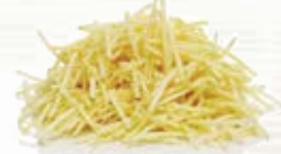
Kålrot strimlad 1562, 3,2 mm, 2 kg 15663, 6 mm, 3 kg