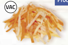
Rotfruktstagliatelle 12599, vac, 2x6 mm, 2 kg kålrot, morot, palsternacka, ROTSELLERI, sötpotatis