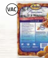
Potatishalvor med skal 4805248, sweet chili & rostad schalottenlök, 6x2 kg*

Krämig premium-gratäng med rapsolja och extra grädde!