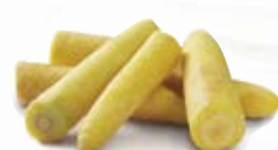
Gul morot 1792, 5 kg