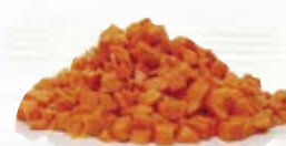
Morot tärnad 1273, 10 mm, 3 kg 12723, 20 mm, 3 kg