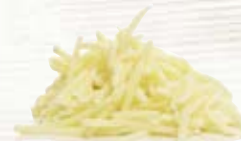
Potatis strimlad 1064, 4,8 mm, 5 kg 1066, 6 mm, 5 kg 1062, 10 mm, 5 kg