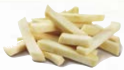
Kålrot stavar 1513, 15 mm, 3 kg