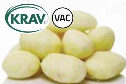
Mospotatis KRAV 21073, vac, KRAV, 33-39/39-43/43-55 mm, 7 kg