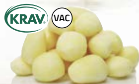
Potatis KRAV 210701, vac, KRAV, 33-39 mm, 39-43 / 43-55 mm, 7 kg