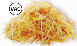
Rotfruktsnudlar 12598, vac, 3,2 mm, 2 kg gul morot, kålrot, morot, palsternacka, ROTSELLERI