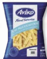
Steakhouse 4803800, 2x5 kg