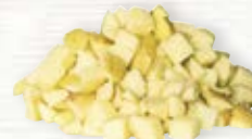
Potatis tärnad med skal 1085, 15 mm, 5 kg