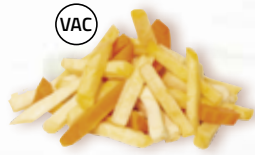
Rotfruktsstavar Selected 15912, vac, 10 mm, 2 kg morot, palsternacka, kålrot