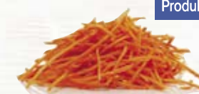
Morot strimlad 1262, 3,2 mm, 2 kg 1263, 6 mm, 3 kg