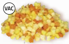
Rotfruktsmix tärnad 15922, vac, 20 mm, 2 kg morot, palsternacka, ROTSELLERI