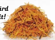
Morotmix 1592, 1,1 mm, 2 kg orange, gul och lila morot

Morot går att odla och lagra i Sverige - därför är den miljövänlig och kan avnjutas svensk nästan hela året.