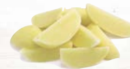
Klyftpotatis utan skal 1094, 4-bitars, 5 kg 1096, 6-bitars, 5 kg