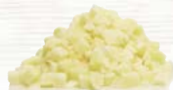
Potatis tärnad 1070, 10 mm, 5 kg 1075, 15 mm, 5 kg 1072, 20 mm, 5 kg