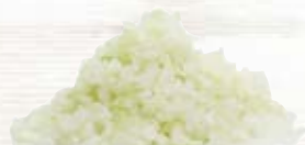
Gul lök tärnad 1373, 3 mm, 1 kg 1370, 6 mm, 1 kg