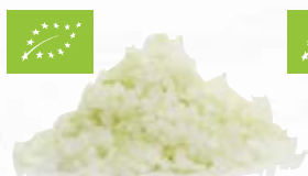
Gul lök tärnad EKO 1379, EKO, 6 mm, 1 kg