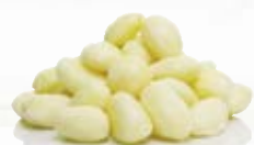
Kulpotatis 1040, ca 30 mm (< 33 mm), 7 kg