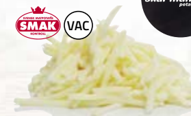
Potatis strimlad 210783, vac, 4 mm, 5 kg 21078, vac, 6 mm, 5 kg