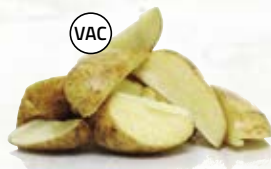
Klyftpotatis med skal 21084, vac, 4-bitars, 5 kg