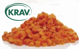
Morot tärnad KRAV 1180, KRAV, 10 mm, 3 kg