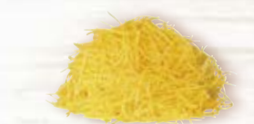
Gul morot riven 1982, 1,1 mm, 2 kg