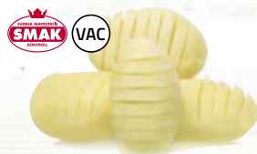
Hasselbackspotatis 21016, vac, 5 kg Kuriosa: Namnet är hämtat från restaurang Hasselbacken som låg i Stockholm på 1940-talet.