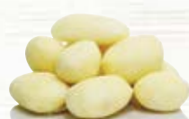
Mospotatis 1020, 32-42/42-52 mm, 7 kg