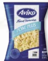
Färsk pommes 4803777, 7 mm, 2x5 kg