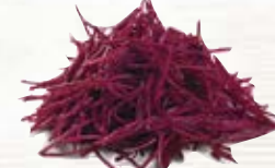
Rödbeta riven 1882, 1,1 mm, 2 kg