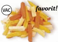
Rotfruktsstavar 1595, vac, 15 mm, 5 kg 12595, vac, 15 mm, 2 kg gul morot, morot, palsternacka, potatis

Blanda rotfrukter i sallader och färsrätter. Hälsosamt, klimatsmart, ekonomiskt och färdigskuret - vilket sparar tid i köket!