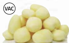
Krögarpotatis 21007, vac, 32-42 mm, 7 kg