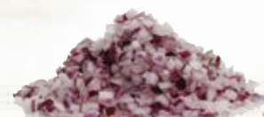
Rödlök tärnad 1473, 3 mm, 1 kg 1470, 6 mm, 1 kg