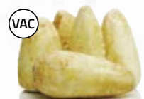
Palsternacka 1600, vac, 5 kg