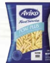
Färsk pommes 4050759, 14 mm, 2x5 kg

Hög & jämn kvalitet • Glutenfria • Endast 3-3,5 minuters tillagningstid • Certifierad och segregerad palmolja En lönsam lösning: högre avkastning och lägre oljeabsorption jämfört med frysta pommes frites