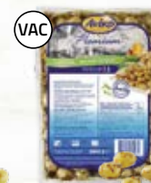
Mini babypotatis 4805247, ramslök, 6x2 kg

Avikos marinerade potatisar är klara att serveras direkt. De passar även perfekt på buffén - varma eller kalla.