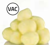
Småplugg 21012, vac, < 33 mm, 7 kg