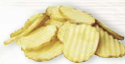
Potatis skivad, räfflad med skal 1081, 5 mm, 5 kg