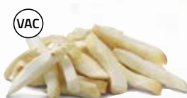
Palsternacka stavar 16152, vac, 10 mm, 2 kg 1615, vac, 15 mm, 5 kg