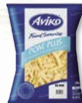
Färsk pommes 4803775, 10 mm, 2x5 kg