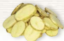
Potatis skivad med skal 1056, 5 mm, 5 kg