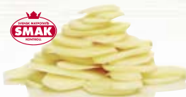
Potatis skivad 1052, 2 mm, 5 kg 1055, 5 mm, 5 kg 1058, 8 mm, 5 kg