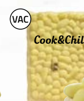
Delikatesspotatis 4802403, 20/30, 5x2 kg