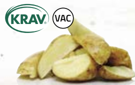
Klyftpotatis med skal KRAV 210703, vac, 4-bitars, KRAV, 5 kg