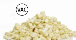
Palsternacka tärnad 1670, vac, 10 mm, 5 kg