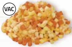
Rotfruktspytt 1594, vac, 10 mm, 5 kg 12594, vac, 10 mm, 2 kg kålrot, morot, palsternacka, potatis