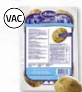
Bakpotatis M 4802222, 250 g, 10x4 st