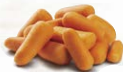
Big baby morot 1196, 2,5 kg