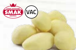
Storkökspotatis 21004, vac, 39-43/43-55 mm, 7 kg