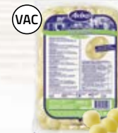
Mini babypotatis 4805231, naturell, 6x2 kg*