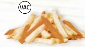
Rotfruktsblandning 15902, vac, 10 mm, 2 kg morot, palsternacka, ROTSELLERI