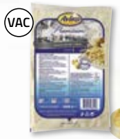
Färsk potatisgratäng Creamy Cheese 4801535, 6x2 kg

Krämig premium-gratäng med rapsolja och extra grädde!