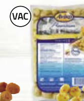
Babypotatis 4805246, citronpeppar, 6x2 kg*