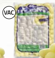
Kulpotatis 4801524, 20/30, 6x2 kg