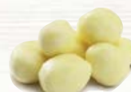
Mospotatis stor 1023, 40-50 / 50+ mm, 7 kg