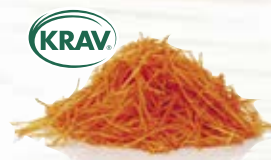
Morot riven KRAV 1182, KRAV, 1,1 mm, 2 kg