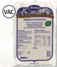
Primus 4805959, 2x5,8 kg

Extra krispig, förfriterad, coatad, färsk pommes frites med solrosolja. Håller sig krispiga upp till 1 timme - utmärkt för catering.