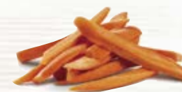
Morot stavar 12152, 10 mm, 2 kg 1213, 15 mm, 3 kg