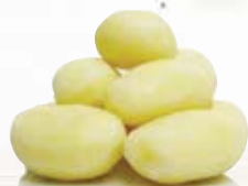
Medelpotatis stor 1013, 48-54 mm, 7 kg