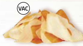
Rotfruktskebab 12592, vac, 2 mm, 2 kg potatis, morot, palsternacka