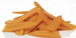
Morot hyvlad 1254, 2 mm, 3 kg