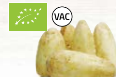
Palsternacka EKO 1192, vac, EKO, 5 kg