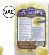
Potatis 4801772, 30/40, 2x5,8 kg