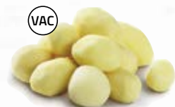
Kulpotatis 21027, vac, 29-37 mm, 7 kg