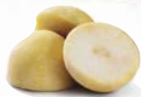
Kålrot 1500, 5 kg