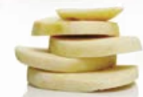
Kålrot i bit 1550, 20 mm, 5 kg