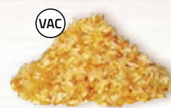
Rotfruktsbas 12593, vac, 1x1 mm, 2 kg finhackad gul lök, morot, palsternacka