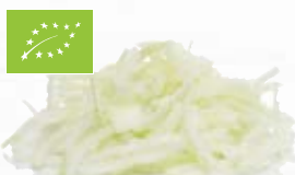
Gul lök skivad EKO 1359, EKO, 5 mm, 1 kg