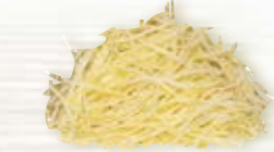
Kålrot riven 15682, 1,1 mm, 2 kg