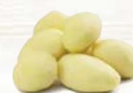
Medelpotatis små 1015, 38-42 mm, 7 kg