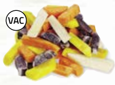
Rotfruktsstavar Lyx 1596, vac, 15 mm, 5 kg blå potatis, gulbeta, morot, palsternacka