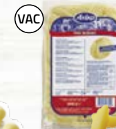
Klyftpotatis 4801530, utan skal, 6x2 kg

Förkokt bakpotatis kan snabbt värmas i mikrougn.