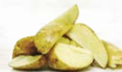
Klyftpotatis med skal 1084, 4-bitars, 5 kg 1086, 6-bitars, 5 kg