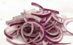
Rödlök skivad 1450, vac, 5 mm, 1 kg