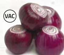
Rödlök 1400, vac, 5 kg