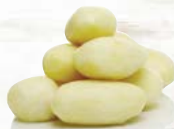
XL-potatis 1011, > 55 mm, 7 kg