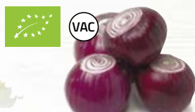
Rödlök EKO 1197, vac, EKO, 5 kg