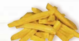
Gul morot stavar 1953, 15 mm, 3 kg