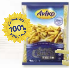
Super Crunch Fresh 4806639, 11 mm, 2x4,5 kg

Extra krispig, förfriterad, coatad, färsk pommes frites med solrosolja. Håller sig krispiga upp till 1 timme - utmärkt för catering.