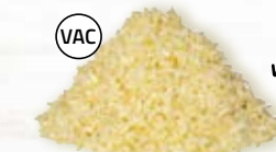
Palsternacksris 1692, vac, 1,1 mm, 2 kg

Palsternacksris är ett gott och klimatsmart alternativ till vanligt ris. Rototto är vårt svar på den italienska klassikern risotto!