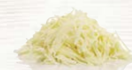
Potatis riven 1068, 1,1 mm, 5 kg i hink