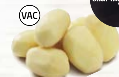
Torparpotatis 21013, vac, 42-52 / 52-60 mm, 7 kg