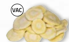
Palsternacka slantad 1650, vac, 5 mm, 5 kg