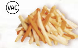
Rotfruktsmix strimlad 15962, vac, 6 mm, 2 kg morot, palsternacka, ROTSELLERI