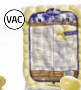
Potatis 4801525, 30/40, 6x2 kg