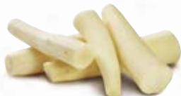
Vit morot 1795, 5 kg