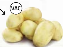
Barsepotatis 21015, vac, 32-45 mm, 7 kg

Kuriosa: Barse kom till när Herr Barse på Åby-travets restaurang i Göteborg önskade en lättskalad potatis som påminde om färskpotatis, men som kunde serveras året runt!