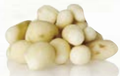
Jordärtskocka 1794, hink, 5 kg