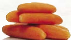
Morot 1200, 5 kg