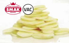
Potatis skivad 210773, vac, 2 mm, 5 kg 210772, vac, 4,5 mm, 5 kg 210777, vac, 6 mm, 5 kg 210776, vac, 8 mm, 5 kg (ej SMÅK-märkt)