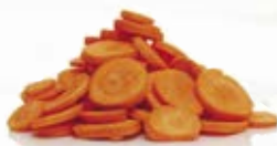
Morot slantad 1253, 5 mm, 3 kg