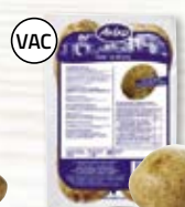
Bakpotatis XL 4802221, 325 g, 8x4 st