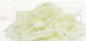
Gul lök skivad 1350, 5 mm, 1 kg