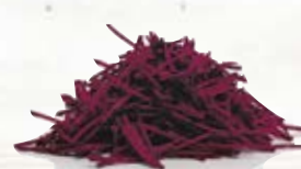
Rödbeta strimlad 17832, 3,2 mm, 2 kg 18863, 6 mm, 3 kg