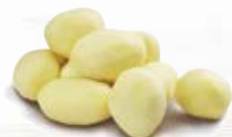
Medelpotatis F4 1014, 42-48 mm, 7 kg