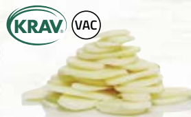
Potatis skivad KRAV 210713, vac, KRAV, 6 mm, 5 kg