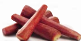
Röd morot 1793, 5 kg