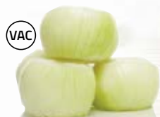
Gul lök 1300, vac, 5 kg