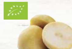
Kålrot EKO 1198, EKO, 5 kg