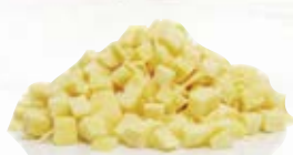
Kålrot tärnad 1573, 10 mm, 3 kg 1523, 20 mm, 3 kg