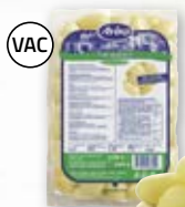
Kulpotatis 4803721, 20/30, 2x5,8 kg