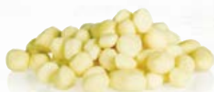
Mospotatis små 1025, 30-40 mm, 7 kg