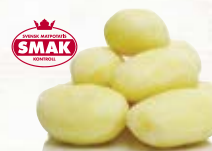
Medelpotatis 1010, 39-54 mm, 7 kg