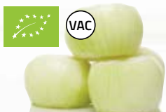
Gul lök EKO 1195, vac, EKO, 5 kg