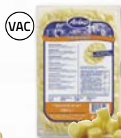
Potatis tärnad 4801531, 16 mm, 6x2 kg