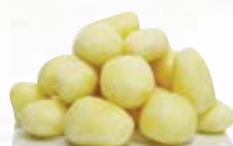
Delikatesspotatis 1030, 33-37 mm, 7 kg