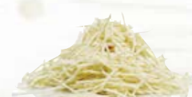
Palsternacka strimlad 16602, 3,2 mm, 2 kg