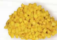
Gul morot tärnad 17973, 10 mm, 3 kg