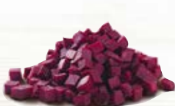
Rödbeta tärnad 1873, 10 mm, 3 kg 18823, 20 mm, 3 kg