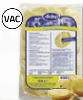
Potatis skivad 4801534, 7 mm, 6x2 kg

Förkokt bakpotatis kan snabbt värmas i mikrougn.