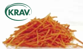
Morot strimlad KRAV 1183, KRAV, 3,2 mm, 2 kg