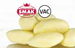
Mandelpotatis 21014, vac, 7 kg